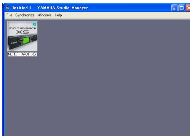
Fenster von Studio Manager

Doppelklicken Sie im Studio-Manager-Fenster auf das Symbol von MOTIF-RACK XS Editor.